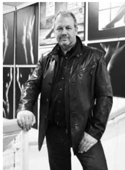
Herry Thanner © Friedrun Reinhold

Foto Thanner Marktplatz 11 | 87700 Memmingen Tel. 08331 2580 | info@fotothanner.de www.fotothanner.de