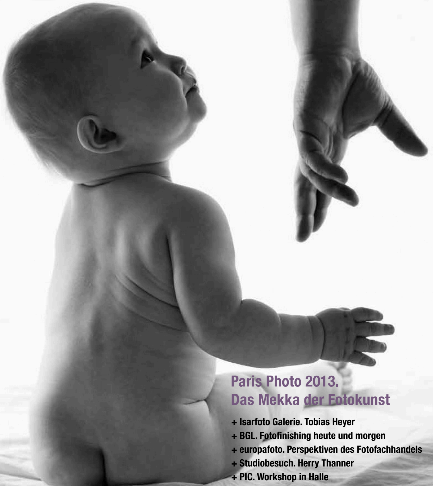
vom 05. Dezember 2013